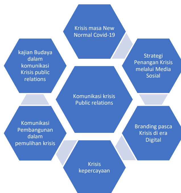
Gambar 3: Kebaruan dalam penelitian krisis public relations

Dalam pembahasan ini menghasilkan beberapa kebaruan yang akan menjadi acuan dalam penanganan krisis public relations dimasa mendatang antara lain: