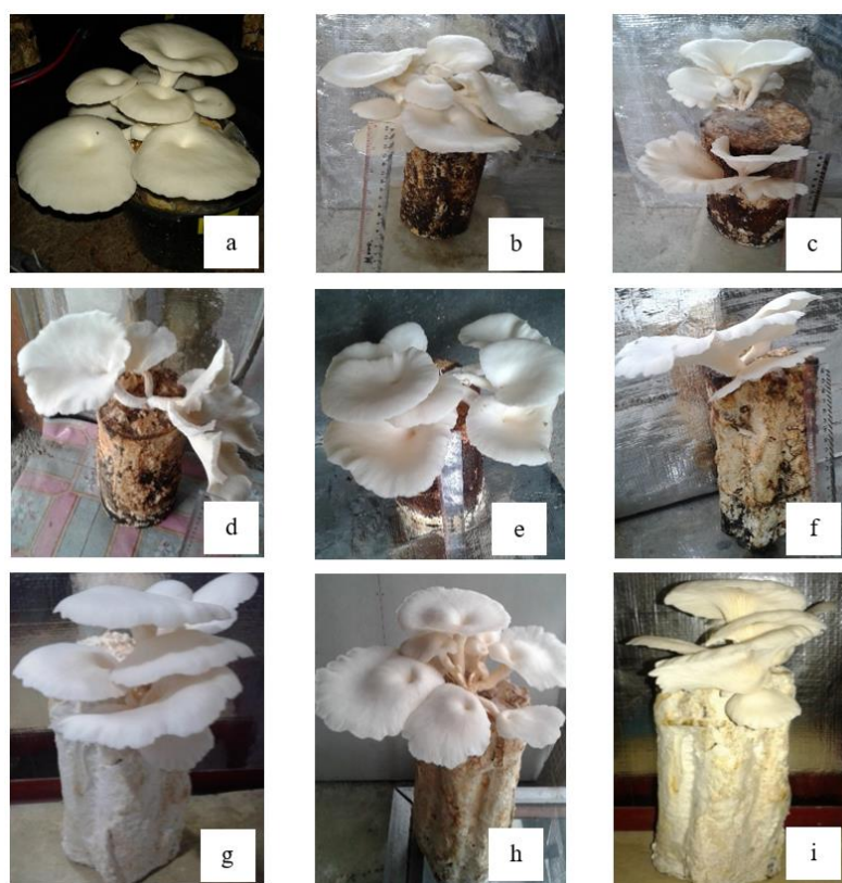
Gambar 2 Morfologi tubuh buah jamur tiram pada berbagai media: a) Kontrol, b) log karet, c) log lamtoro, d) log randu, e) log balsa, f) ranting karet, g) ranting lamtoro, h) ranting randu, dan i) ranting balsa

Analisis Proksimat adalah suatu metode analisis kimia yang digunakan untuk mengidentifikasi kandungan zat makanan pada suatu bahan (Novianty 2014). Hasil analisis proksimat tubuh buah jamur tiram dari berbagai media disajikan pada Tabel 5 di bawah ini.