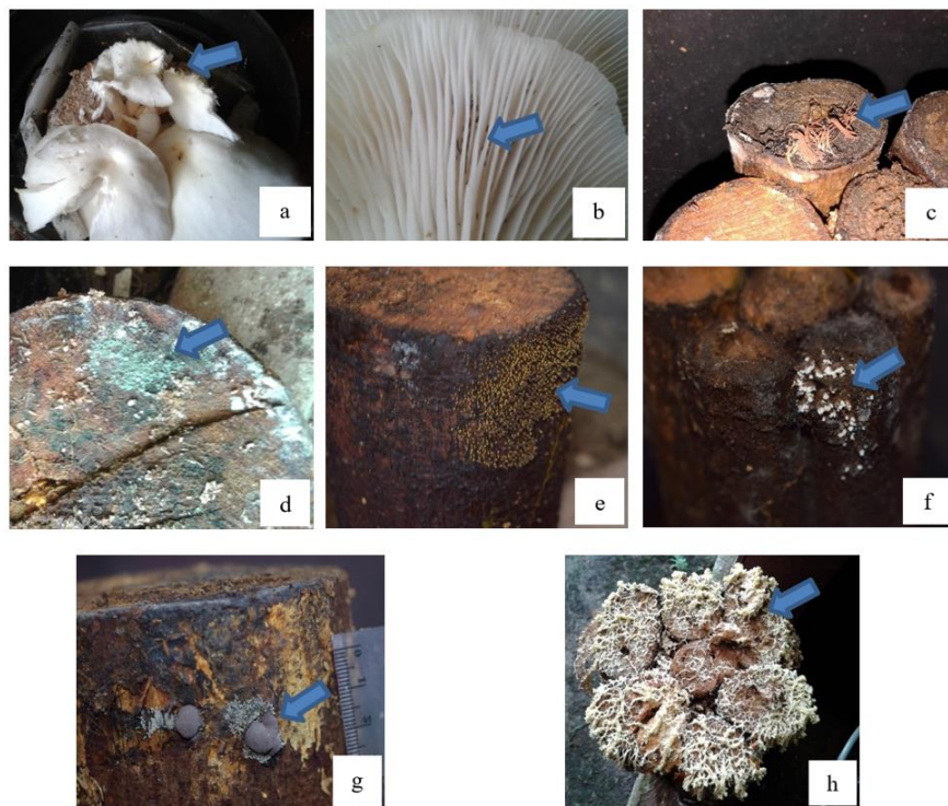
Gambar 3. Hama dan penyakit yang menyerang media dan tubuh buah: (a) kerusakan serangan tikus (b) tungau (c) Stemonitis sp. (d) Trichoderma sp., (f) Physarium Spp., (g) Daldinia concentrica , dan (h) Stemonitis sp. fase plasmodium.

Lama waktu fase vegetatif seluruh media secara umum tidak berbeda nyata dan berkisar antara 14-30 hari. Lama waktu fase vegetatif diseragamkan menjadi 60 hari (2 bulan). Penyeragaman bertujuan untuk meyakinkan bahwa miselium sudah masuk dalam media kayu. Media randu baik jenis log maupun ranting memiliki pertumbuhan fase vegetatif lebih cepat dibanding media lain yaitu 14 hari. Media yang memiliki fase vegetatif paling lama adalah kontrol (serbuk gergaji) yang mencapai 30 hari. Hal ini diduga dipengaruhi oleh faktor teknik inokulasi. Penaburan bibit pada media kontrol hanya pada salah satu