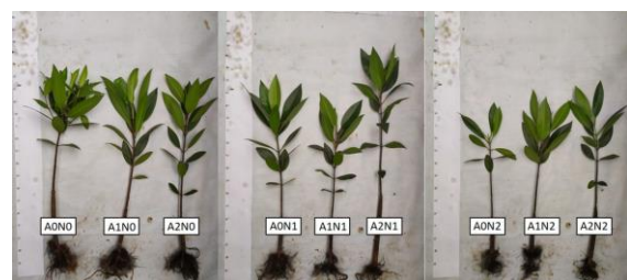
Gambar 3 Keragaman pertumbuhan pucuk dan akar bibit B. gymnorrhiza berumur 6 bulan pada berbagai kombinasi perlakuan media tanam dengan intensitas cahaya

Nilai dengan huruf yang berbeda menunjukkan perbedaan nyata pada selang kepercayaan 95%