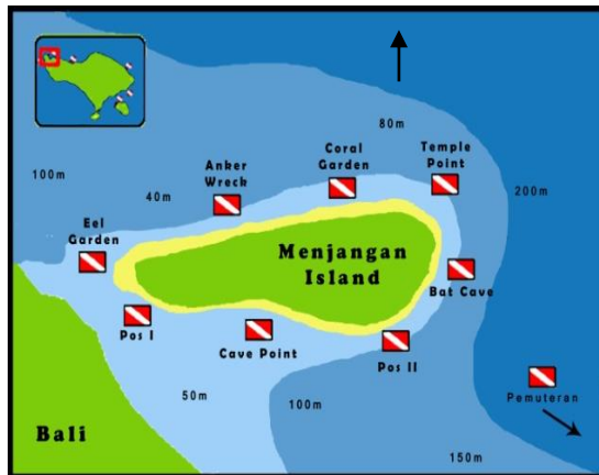
Gambar 2 Spot diving dan snorkeling Pulau Menjangan (TNBB, 2016).

Ekowisata adalah perjalanan wisata yang bertanggung jawab terhadap kelestarian lingkungan dan kesejahteraan masyarakat setempat. Perkembangan ekowisata mempengaruhi masyarakat pada aspek ekologi, sosial, dan ekonomi. Ekowisata merupakan pariwisata yang mengedepankan aspek konservasi ekologi. Untuk itu, keberlanjutan ekowisata ditentukan oleh aspek ekologi (Hijriati, 2014).