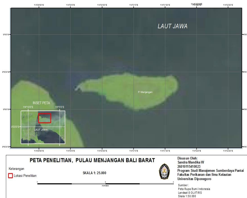
Gambar 2 Lokasi Penelitian