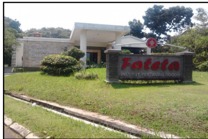
Gambar 1. Gedung Pusat Informasi Teknologi Pertanian IPB

Perpustakaan PITP yang didirikan pada tahun 2009 merupakan gabungan Perpustakaan Fateta dengan Perpustakaan SEAFASST Center. Perpustakaan PITP dikukuhkan dengan Keputusan Dekan Fakultas Teknologi Pertanian IPB Nomor: 21/I3.6/KP/2010 tanggal 20 April 2010 tentang