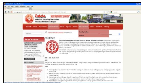
Gambar 3. Tampilan Situs http://fateta.ipb.ac.id

penelitian), ART (majalah/jurnal), dan Standar (SNI dan Codex); (5) Perangkat Jaringan : internet dan LAN ( local area network ) yang menghubungkan komputer pengolahan data, server dan OPAC. Koneksi internet disediakan bagi pemustaka dengan mengaktifkan Wifi pada laptop pemustaka. Layanan online perpustakaan dapat diakses melalui situs http://fateta.ipb.ac.id . Pada menu Perpustakaan dapat diperoleh informasi tentang katalog buku, skripsi, tesis, disertasi, Standar Nasional Indonesia (SNI) dan artikel (Gambar 3).