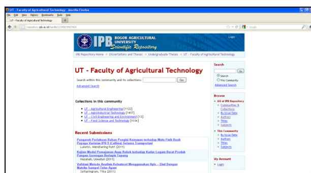
Gambar 4. Tampilan IPB Scientific Repository

Jenis bahan pustaka yang lain yang dihimpun Perpustakaan PITP adalah skripsi karya lulusan Fakultas Teknologi Pertanian dalam bentuk tercetak. Adapun bentuk softfile nya diserahkan oleh mahasiswa ke Perpustakaan Pusat. Selanjutnya softfile tersebut akan diunggah ke IPB Scientific Repository.