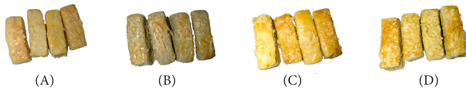
Figure 2 Kaasstengels cookies with addition of seaweed flour; (A) control; (B) with addition of Sargassum sp., (C) with addition of U. lactuca , (D) with addition of Sargassum sp. and U. lactuca

The value different letter in the same column showed a statistically significant difference ( p < 0.05 )