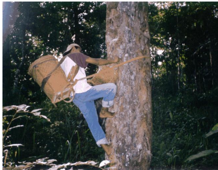
Gambar 2. Teknik Pemanenan Getah Damar