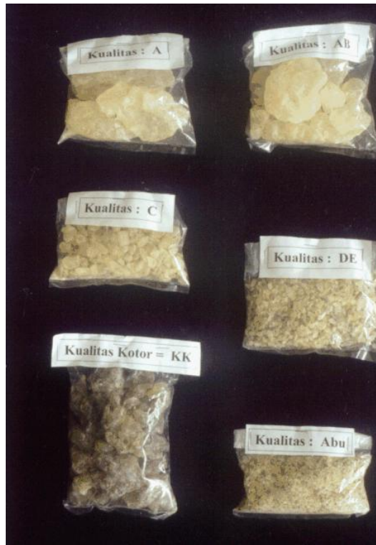
Gambar 3. Pengelompokan Getah Damar dalam Berbagai Kualitas