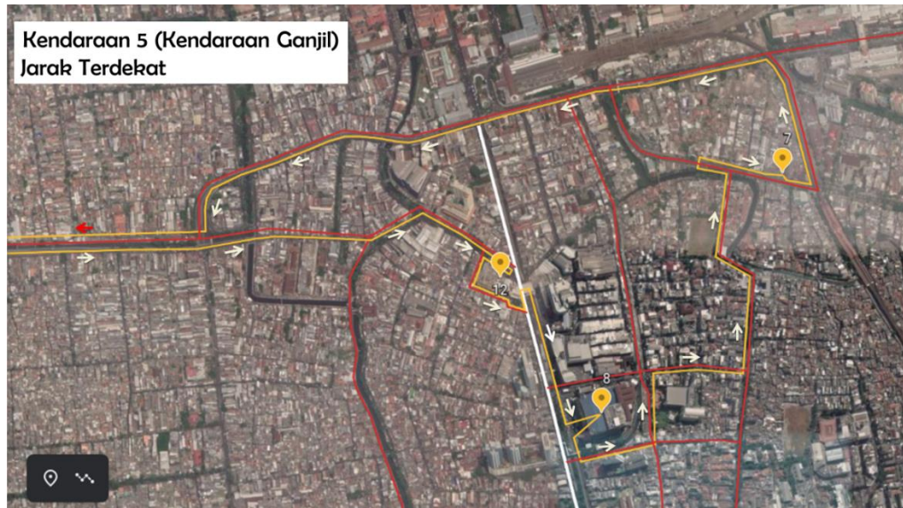
Gambar 3 Rute Kendaraan 5 dengan jarak terdekat

Dari Tabel 4 dan Tabel 5 terlihat bahwa tidak semua kendaraan digunakan dalam kegiatan pendistribusian. Selain itu, dari kendaraan yang digunakan, terdapat kendaraan yang ganjil/genap nomor-polisinya tidak sesuai dengan ganjil/genapnya tanggal distribusi.