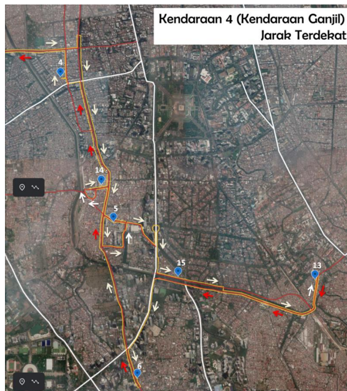
Gambar 2 Rute Kendaraan 4 dengan jarak terdekat