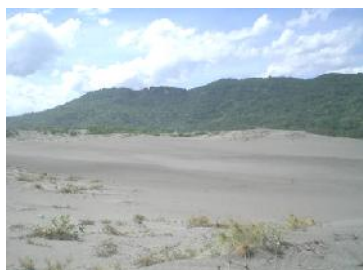
Gambar 3. Gumuk pasir terdegradasi

Kawasan Pantai Parangtritis dan area gumuk pasir seluas kurang lebih 203,6 hektar ini memiliki iklim ekstrim kering dengan temperatur maksimum 40°C dan temperatur rata-rata 32°C, serta curah hujan tahunan sebesar 1.500 - 2.000 mm dengan vegetasi sangat jarang (Kanopindo, 2007). Atas dasar data iklim ini, proses terjadinya gumuk pasir, dan materi pembentuk gumuk pasir, dapat dipastikan bahwa erosi angin yang terjadi di kawasan ini didominasi oleh tingginya erodibilitas tanah (I), faktor iklim terutama temperatur tinggi (C), lebar area/lahan (L) dan rendahnya kerapatan vegetasi (V). Dari empat faktor penyebab erosi angin yang mendominasi ini, kerapatan vegetasi (V) merupakan faktor yang paling mungkin dapat dikerjakan, karena dapat memberikan dampak positif paling menguntungkan. Perlakuan vegetasi disamping dapat menurunkan erodibilitas tanah juga secara nyata dapat menurunkan tingkat pengaruh erosivitas angin. Upaya ini sesuai dengan kondisi lapangan kawasan yang memiliki kerapatan vegetasi rendah dan tingkat erosi (degradasi) gumuk pasir yang telah terjadi (Gambar 3 dan 4). Gumuk pasir bergerak ( moving sand dunes ) lebih banyak disebabkan oleh proses rayapan partikel tanah di bagian balik gumuk ( backdunes ). Gerakan gumuk pasir sampai saat ini telah mencapai jarak 2,3 kilometer dari garis pantai (Kanopindo,2007). Erosi angin gumuk pasir dalam bentuk rayapan tanah (Gambar 5).