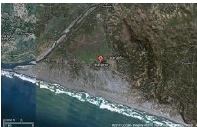
Gambar 1. Kawasan wisata Pantai Parangtritis.

Pantai Parangtritis berada dalam Desa Parangtritis, berjarak kurang lebih 27 kilometer di sebelah selatan Kota Yogyakarta dan 13 kilometer dari pusat kecamatan Kretek Bantul DIY. Kawasan Parangtritis dibatasi oleh aliran Sungai Opak di bagian barat laut dan utara, perbukitan Parangtritis (formasi Wonosari) di sebelah utara-timur laut, serta samudra Indonesia di bagian selatan. Berdasarkan topografinya, kawasan Parang-tritis dibagi menjadi dua bagian besar, yaitu dataran rendah yang meliputi wilayah daerah aliran sungai dan muara Sungai Opak, wilayah sepanjang garis pantai, serta dataran tinggi yang meliputi perbukitan Parangtritis (formasi Wonosari) yang membentang dari daerah Bibis di bagian utara hingga daerah Parangendok-Gambirowati di bagian selatan (Gambar 1).