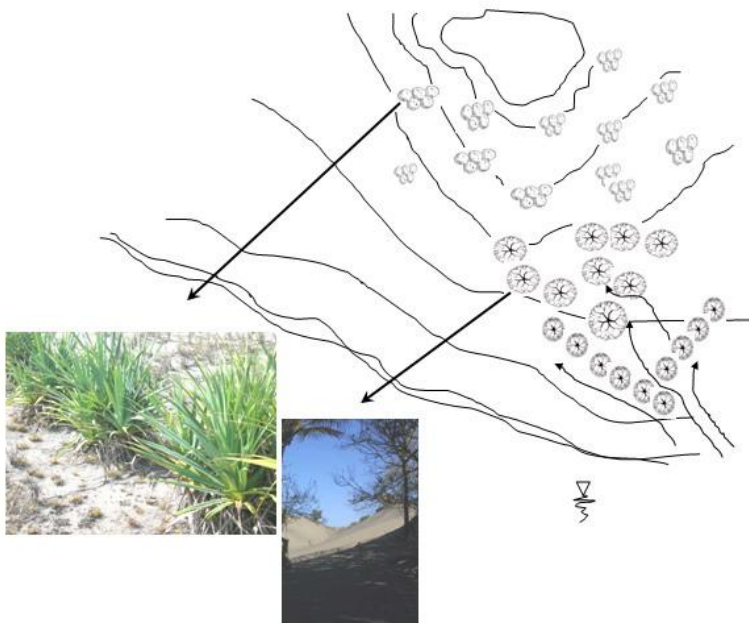
Gambar 7. Desain Teknologi Konservasi Satu Unit Formasi Gumuk Pasir Parangtritis

lingkungan dan sumberdaya alam sebagai bidang garap utama.