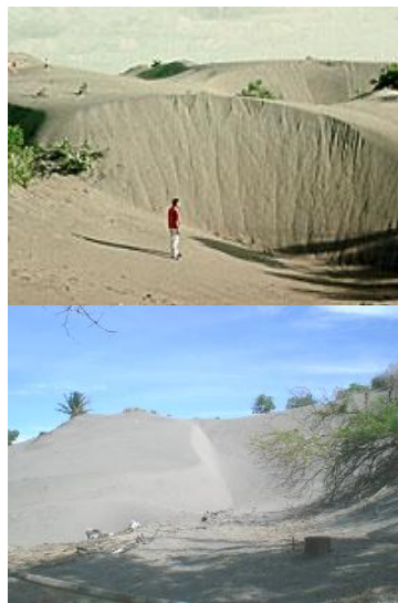
Gambar 2. Gumuk pasir di kawasan wisata Pantai Parangtritis.

Gumuk pasir yang terdapat dalam kawasan wisata Pantai Parangtritis merupakan salah satu potensi lanskap yang dapat meningkatkan daya tarik obyek (Gambar 2).