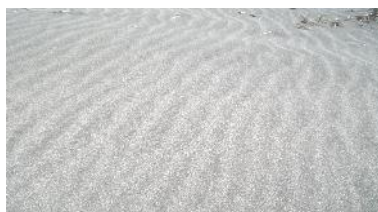
Gambar 5. Rayapan partikel pasir gumuk