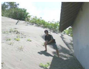
Gambar 4. Gumuk pasir bergerak mendekati pemukiman