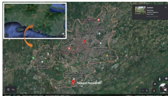
Gambar 1. Peta Citra Kabupaten Jember

Penelitian dilaksanakan pada bulan April sampai dengan Oktober 2020 di Kabupaten Jember. Kajian standardisasi ini menggunakan pendekatan benchmarking dengan data sekunder yang diperoleh melalui pengisian kuesioner oleh responden, dan studi pustaka dari berbagai literatur terkait standardisasi pekerjaan pemeliharaan yang ada pada Dinas Pertamanan Kabupaten Jember dan standar desain berdasarkan Permen PU Nomor 05/PRT/M/2008. Penentuan responden untuk penetapan standardisasi pekerjaan pemeliharaan didasarkan pada kredibilitas profesionalisme yang sudah diberikan oleh perusahaan atau organisasi responden di bidang pemeliharaan lanskap dalam kurun waktu tertentu dan terbukti telah berhasil mengorganisasi pekerjaan pemeliharaan dengan baik.