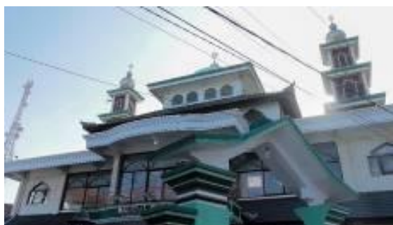
Gambar 4. Ragam Hias Rumah Tinggal

Bangunan peribadatan masyarakat Kampung Kusamba, yaitu Masjid Al-Mahdi juga menunjukkan adanya sejumlah ciri arsitektural bangunan Bali. Minaret atau menara masjid berwujud seperti bangunan tumpang tiga dan dikombinasikan dengan bentuk kubah di bagian puncaknya (Gambar 4). Bentuk tersebut mirip dengan struktur meru pada bangunan di pura-pura Bali.