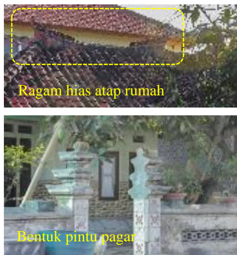
Gambar 3. Ragam Hias Rumah Tinggal

Saat pengambilan data penelitian, masih terlihat beberapa bangunan tempat tinggal masyarakat Kampung Kusamba dengan ciri arsitektural dekoratif yang cukup umum dijumpai pada rumah-rumah dengan arsitektur tradisional Bali (Gambar 3). Unsur dekoratif tersebut dijumpai pada bagian atap dan juga bentuk arsitektur pintu pagar rumah beberapa penduduk.