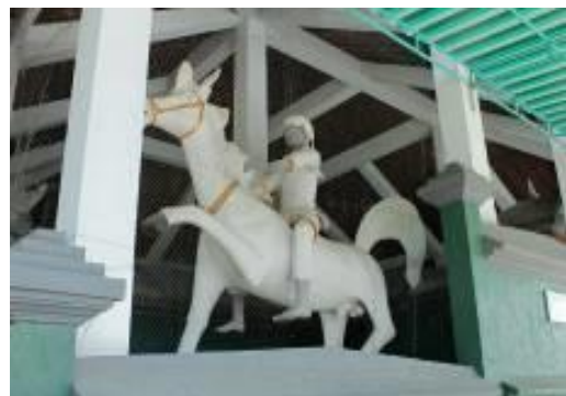
Gambar 5. Patung Habib Ali

Makam Habib Ali bin Abu Bakar Umar al Hamid saat ini berada dalam satu bangunan dengan dua pintu yang terletak di sisi sebelah utara dan sebuah pintu lain di sisi timur bangunan. Kedua pintu akses tersebut menggunakan pintu dengan model ukiran Bali (Gambar 6). Demikian pula jika diamati dinding bangunan di sekeliling makam tersebut lebih menyerupai pagar penyenger seperti umumnya pagar yang dapat dijumpai pada bangunan tradisional masyarakat Bali.