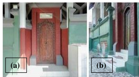
Gambar 6. Arsitektural luar makam Habib Ali bin Abu Bakar Umar Al Hamid