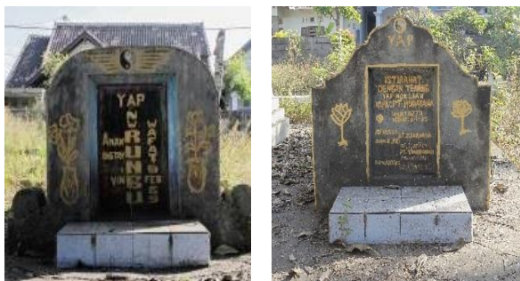
Gambar 7. Makam Cina di Kampung Kusamba

Selain makam Islam, di Kampung Kusamba juga dijumpai makam Cina. Informasi yang didapat di lapang dari narasumber (Samsul, 2019) mengatakan bahwa saat ini keluarga pemilik makam Cina di Kampung Kusamba sudah tidak menetap lagi di sana. Namun ada keturunannya yang menetap di Desa Kusamba dan beberapa lainnya tersebar di daerah pulau Bali lainnya. Sekali setahun keluarga dari pemilik makam datang membersihkan makam dan berziarah. Pengamatan di lapang mengindikasikan bahwa yang dimakamkan di area tersebut berasal dari satu keluarga atau setidaknya berasal dari satu marga. Beberapa nisan yang masih terbaca tulisan informasi almarhum yang dimakamkan menunjukkan marga Yap yang disertai juga dengan nama khas Bali yang dimiliki almarhum seperti N.W. Rungu, Pt. Mudayana , dan beberapa nama lain yang menunjukkan keturunannya (Gambar 7).