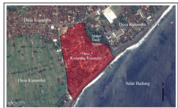
Gambar 2. Peta Posisi Desa Kampung Kusamba

Posisi geografis Desa Kampung Kusamba dikelilingi oleh Desa Kusamba dan Selat Badung (Gambar 2). Kondisi ini membuat pola tata ruang Desa Kampung Kusamba terhadap Desa Kusamba menyerupai enclave . Wilayah kepemilikan Kampung Kusamba memenuhi kriteria definisi enclave seperti disebut oleh Rozhkov (2013), yaitu sebidang lahan kecil yang terletak "di dalam" lahan milik yang lain.