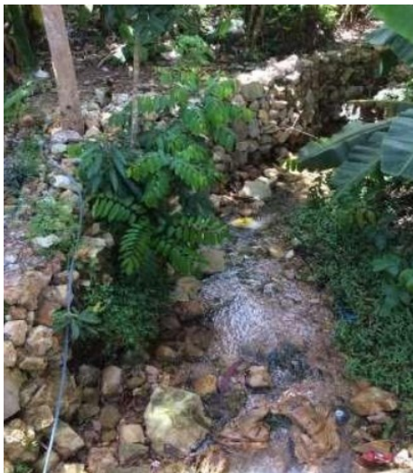
Gambar 5. Kondisi aliran percabangan sungai pada musim kemarau di Pulau Karimunjawa

yang berbentuk akibat kelurusan yang diperkirakan sebagai sesar (Hadi et al. , 2006). Karakteristik akuifer di Pulau Karimunjawa dipengaruhi oleh litologi batuan yang berasal dari Formasi Parang. Data pengukuran menunjukkan produktivitas sedang dengan nilai debit sumur rata-rata 2 L/detik yang berpotensi untuk dikembangkan sebagai wilayah pemukiman (Maulana dan hadian, 2016).