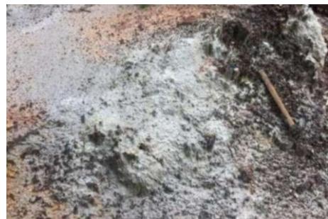
Gambar 3. Endapan pasir lepas di Pulau Karimunjawa

Geologi Pulau Karimunjawa secara garis besar terbentuk oleh endapan aluvium pantai yang terdiri dari endapan pasir lepas dan endapan rawa serta Formasi Karimun. Endapan pasir lepas (Gambar 3) tersusun oleh pasir kasar sampai dengan halus, lanau dan lempungan, serta berwarna kelabu keputihan dan bersifat lepas. Endapan rawa dicirikan oleh lapisan lempung yang lunak, berwarna kelabu kehitaman, dan memiliki kandungan karbonat yang tinggi. Pergerakan sebaran jenis sedimen pasir pada dasar perairan dipengaruhi oleh faktor arus laut, khususnya arus pada kolom laut. Sedimen pasir yang terangkut berupa bed load (menggelinding dan bergeser di dasar laut). Jika kecepatan arus berkurang, maka arus tidak mampu mengangkut sedimen sehingga akan terjadi proses sedimentasi (Saratoga et al. , 2014).