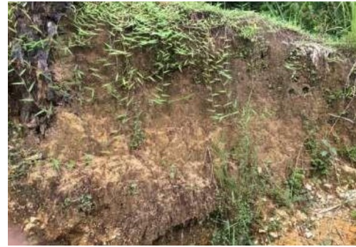
Gambar 4. Tanah aluvial di Pulau Karimunjawa

garis besar, Pulau Karimunjawa tersusun dari endapan pasir lepas, endapan rawa, dan endapan aluvial (Gambar 4). Formasi Karimun dan Formasi Parang Litologi merupakan faktor utama yang berperan di dalam proses pembentukan tanah.