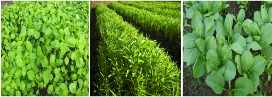
Gambar 1. Contoh komoditas sayuran organik di tingkat kelompok tani

Poktan sebagai pendekatan berbasis petani dapat memberikan pekerjaan untuk petani yang tersebar dalam wadah kelompok maupun gabungannya untuk memproduksi produk pertanian konvensional maupun organik dalam skala ekonomi, serta penyebaran teknik produksi yang baku (mulai dari input hingga output , termasuk mutu produk akhir) dan kemudahan penyuluhan dan pembelajaran antar sesama petani. Dalam hal ini pertanian organik dibandingkan dengan pertanian konvensional memiliki ciri seperti biaya produksi lebih rendah, harga jual tinggi, produktivitas lebih tinggi, penggunaan pupuk dan pestisida alami, berlabel, keunikan dan daya tarik pedesaan sebagai bagian dari daya saingnya.