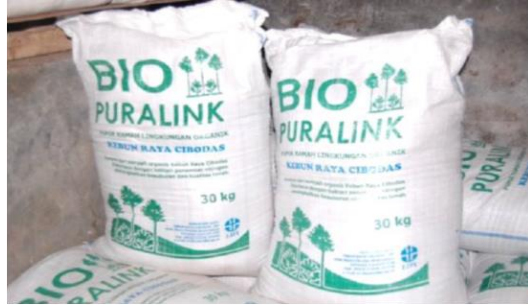
Gambar 1. Kompos Bio Puralink produksi Kebun Raya Cibodas-LIPI.

Kompos yang diproduksi KRC diberi label Biopuralink (Gambar 1) yang dimanfaatkan untuk kegiatan internal KRC sebagai bahan pupuk organik pada kegiatan pemeliharaan tanaman dan sebagai media tanam tanaman koleksi. Secara eksternal pemanfaatan kompos Biopuralink juga biasa digunakan pada kegiatan penghijauan dan untuk dijual pada masyarakat umum. Kompos Biopuralink diproduksi KRC sebanyak 19.29 ton pada periode tahun kerja 2013 (KRC, 2013) dan 27.35 ton pada tahun 2014 (KRC, 2014). Saat ini Unit Kompos KRC sedang melakukan upaya pengembangan produksi dan peningkatan kualitas kompos.