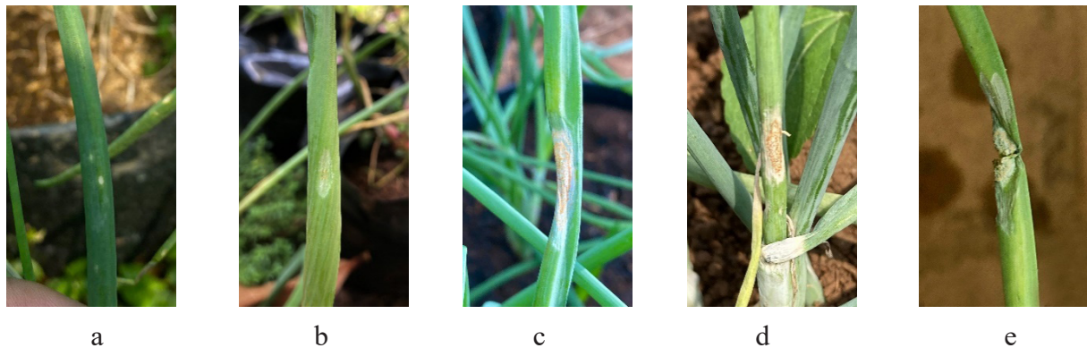
Gambar 1 Perkembangan gejala antraknosa pada bawang merah. a, bercak kecil berwarna putih; b, bercak putih membesar; c, bercak putih ditumbuhi massa aservulus dan konidium dengan tanda adanya bintik-bintik kuning kecokelatan membentuk pola silindris mengitari pada bercak putih; d, gejala bintik-bintik kuning kecokelatan lebih jelas pada bagian proximal daun; e, kerusakan lanjut tampak kumpulan aservulus pada daun.