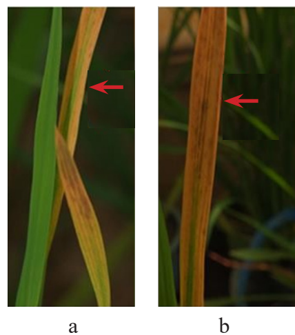
Gambar 2 Gejala penyakit tungro. a, Klorosis atau chlorotic mottle (←); dan b, Nekrosis (←).

Insidensi penyakit menunjukkan kejadian penyakit tanaman dalam suatu populasi tertentu dalam suatu wilayah dan tidak