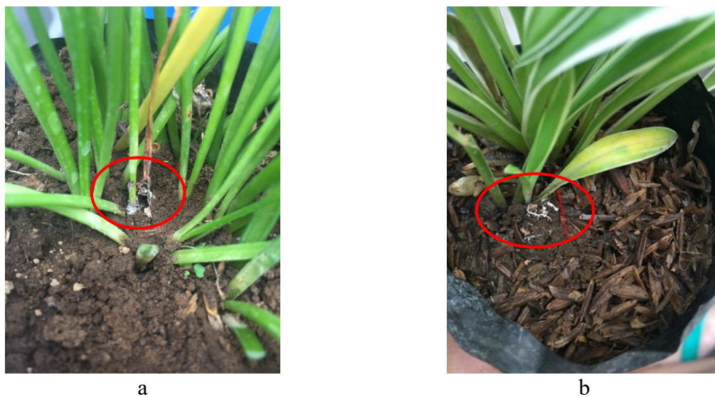
Gambar 2 Gejala penyakit tanaman berupa klorosis dan busuk pangkal batang (dalam lingkaran) pada tanaman yang diinokulasikan Sclerotium rolfsii .a, Lili hujan dan b, lili paris.

ketika kelembapan lingkungan mendukung. Kemudian pada permukaan koloni akan terbentuk sklerotium yang berwarna putih, cokelat muda sampai cokelat tua berdiameter 1–3 mm. Sklerotium S. rolfsii memiliki bentuk hampir bulat dengan permukaan licin tersebar diseluruh permukaan koloni. Infeksi umbi tanaman lili oleh S. rolfsii menyebabkan kerugian di Cina dan keberadaan umbi yang terinfeksi juga mengganggu kegiatan distribusi umbi ke daerah lain.