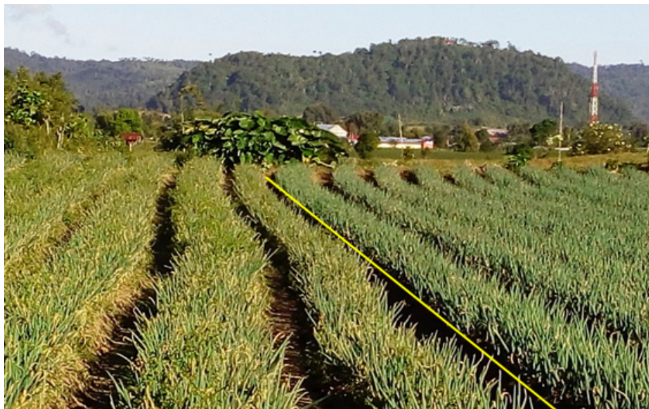
Gambar 2 Tingkat serangan P. allii pada pertanaman bawang daun yang tidak dan yang diaplikasi fungisida berbahan aktif campuran azoxistrobin dan difenokonazol. Tingkat serangan tinggi, (sebelah kiri garis kuning, tanpa aplikasi fungisida) dan rendah (sebelah kanan garis kuning, diaplikasi fungisida).

Dari contoh lahan di empat desa yang diamati, insidensi penyakit mencapai 100% dan keparahan penyakit berkisar 30%–50%. Insidensi yang tinggi ini sangat mungkin terjadi, karena urediniospora P. allii sangat mudah dipencarkan oleh angin (Hill 1995). Beberapa petani di tempat survei yang telah melakukan pengendalian dengan fungisida berbahan aktif campuran difenokonazol dan azoxistrobin menunjukkan tingkat keparahannya rendah (Gambar 2). Meskipun bahan aktif fungisida tersebut saat ini efektif mengendalikan, tetapi pemantauan secara rutin kemungkinan