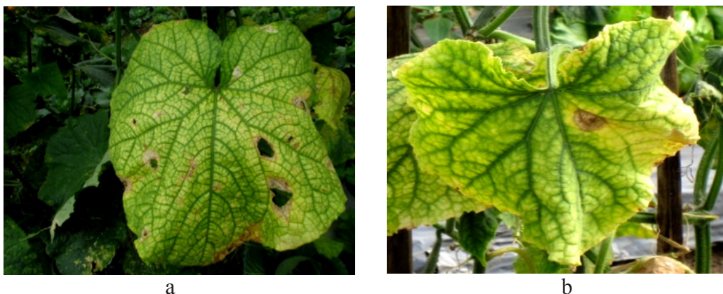
Gambar 1 Variasi gejala Begomovirus pada tanaman mentimun di Bali. a, gejala menguning dan menggulung; b, gejala menguning dan tulang daun menjari.

Metode yang digunakan untuk mendeteksi Begomovirus ialah polymerase chain reaction dengan primer universal Begomovirus SPG1/SPG2. Primer universal Begomovirus tersebut akan mengamplifikasi bagian gen transcriptional activator protein (TrAp) dan replication-associated protein (Rep) dengan ukuran target \pm 900 pb (Li et al. 2004). Ekstraksi DNA total dari sampel daun mentimun menggunakan metode Doyle