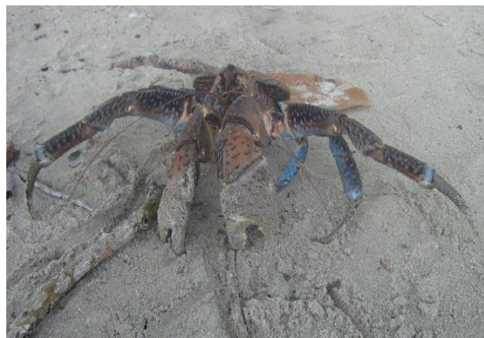
Gambar 1. Kepiting kelapa ( Birgus latro )

Tujuan dari penelitian ini adalah untuk mengetahui sintasan ( survival rate ), kematian ( mortalitas ) dan pertumbuhan berat tubuh kepiting kelapa yang dipelihara pada kolam penangkaran dalam rangka domestikasi. Informasi yang didapat diharapkan dapat dijadikan landasan untuk kegiatan budidaya dalam rangka upaya konservasi biota tersebut.