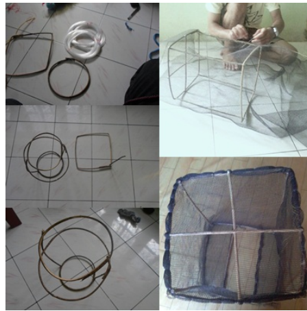
Gambar 1. Pembuatan wadah keranjang jaring