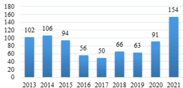
Gambar 1. Jumlah mahasiswa program sinergi 2013-2021

Salah satu input dalam penyelenggaraan program pascasarjana di IPB adalah mahasiswa. Berdasarkan Gambar 1, perkembangan jumlah mahasiswa program sinergi SPs IPB sejak awal pelaksanaan yaitu 2013 dan 2014 cenderung sedikit meningkat, sedangkan tahun 2015 hingga 2017 mengalami penurunan. Pada tahun 2018 hingga saat ini jumlah peserta sinergi SPs IPB terus mengalami peningkatan. Tahun 2020 dan 2021 terjadi peningkatan signifikan jumlah mahasiswa sinergi. Peningkatan jumlah signifikan tersebut diduga karena bertepatan dengan faktor pandemi covid-19 yang menerapkan sistem pembelajaran non-tatap muka ( online ). Oleh karena itu, perlu adanya analisa yang dapat mengetahui sejauh mana minat mahasiswa sarjana untuk mengikuti program sinergi SPs.