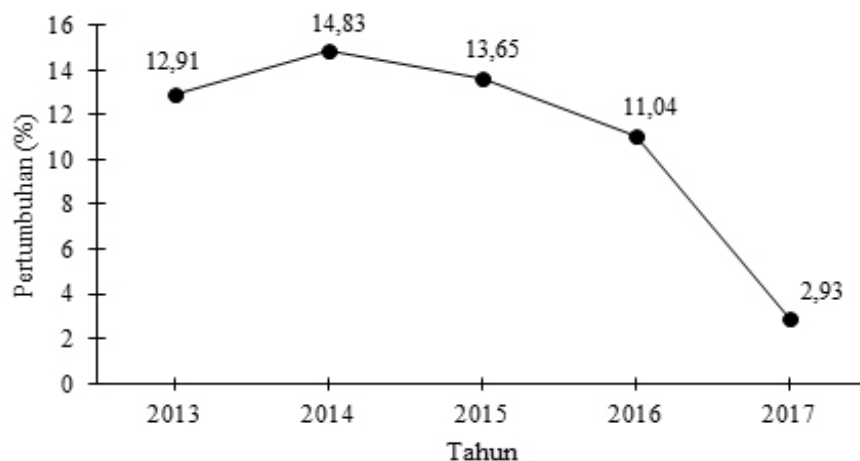
Gambar 1. Rata-rata pertumbuhan tahunan penjualan riil ritel 2013–2017

Bertolak belakang dengan fakta yang terjadi di lapangan, kinerja ritel mengalami penurunan dari sisi rata-rata pertumbuhan penjualan. Hasil Survei Penjualan Eceran (SPE) yang dilakukan oleh Bank Indonesia, memperlihatkan adanya tren penurunan terhadap rata-rata pertumbuhan tahunan penjualan riil untuk ritel selama periode 2013–2017 (Gambar 1). Bahkan pada 2017, rata-rata pertumbuhan tahunan penjualan riil untuk ritel hanya sebesar 2,93% ( www.bi.go.id ). Rata-rata pertumbuhan tersebut jauh berada di bawah rata-rata pertumbuhan double digit industri ritel Indonesia yang menurut AC Nilesen besarnya berada pada kisaran 10–11%. Fenomena sepanjang tahun 2017 tentang banyaknya pemain besar ritel yang menutup gerai offline miliknya seperti Matahari Department Stores (PT Matahari Department Store Tbk), Debenhams, Lotus (PT Mitra Adiperkasa Tbk) dan Hero (PT Hero Supermarket Tbk) semakin memperkuat indikasi kesulitan finansial ( financial distress ) yang tengah terjadi pada industri ritel Indonesia.