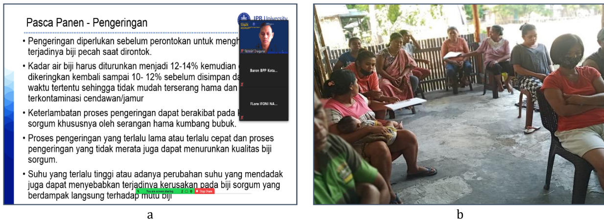
Gambar 2 Kondisi selama pembelajaran daring a) Penyampaian materi dan b) Peserta pelatihan.

tanpa nitrogen (Poespodihardjo 1983), sedangkan bobot kering daun sorgum mengandung 7,82% protein kasar, 2,60% lemak, 28,94% serat kasar, 11,43% abu, dan 40,57% bahan ekstrak tanpa nitrogen (Direktorat Jenderal Perkebunan 1996). Untuk meningkatkan pengetahuan petani dalam memanfaatkan limbah produksi sorgum, maka diberikan materi pelatihan ketiga, yaitu pengolahan limbah sorgum sebagai pakan ternak.