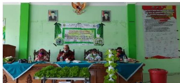
Gambar 2 Pelatihan Hidroponik di Desa Pacul.

Pembuatan media tanam hidroponik dilakukan dengan cara praktik langsung oleh narasumber dengan menjelaskan kepada peserta. Pembuatan hidroponik dimulai dengan mempersiapkan media, yaitu botol atau gelas plastik bekas minuman dilubangi dan dipasang