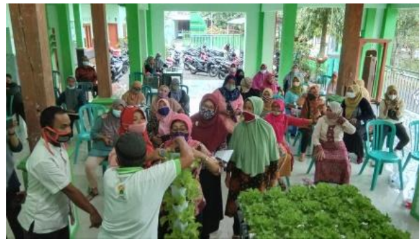
Gambar 3 Praktik pembuatan tanaman media hidroponik di Desa Pacul.

Salah satu kendala dalam kegiatan pelatihan dan sosialisasi ini adalah dalam penyesuaian waktu yang tepat antara narasumber dan peserta