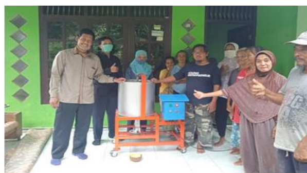
Gambar 3 Dokumentasi penyerahan mesin spinner kepada mitra.

Hasil luaran yang diharapkan kelompok tani Pesona Jamur selaku mitra pengabdian adalah suatu teknologi tepat guna untuk meningkatkan produktifitas dan kualitas keripik jamur tiram. Upaya yang dilakukan tim adalah membuat mesin spinner untuk meminimalkan kandungan minyak pada produk keripik jamur tiram. Gambar 3 menunjukkan dokumentasi penyerahan mesin spinner kepada mitra kelompok tani Pesona Jamur. Penyerahan mesin secara simbolis diterima langsung oleh ketua kelompok tani Pesona Jamur.