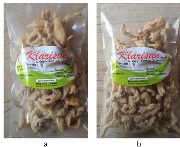
Gambar 5 Produk keripik jamur dalam kemasan plastik: a) Keripik tidak dispinner dan b) Keripik diproses spinner .

Kegiatan pengabdian kepada masyarakat pada kelompok tani Pesona Jamur terlaksana dengan baik sesuai tujuan. Parameter waktu yang optimal untuk memproses keripik jamur, yaitu