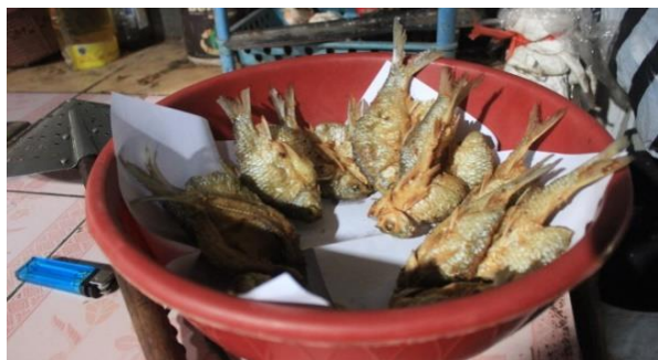
Gambar 3 Metode penirisan minyak pertama keripik ikan tawes.