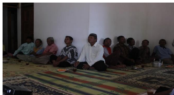
Gambar 1 Pelatihan pengembangan motivasi usaha.

Kegiatan ini juga dihadiri oleh 33 rumah tangga di Dusun Watupecah yang tergabung dalam kelompok nelayan Sumber Rejeki. Pelatihan bertujuan untuk memberikan pemahaman kepada peserta program tentang pentingnya manajemen (pengelolaan) waktu dan perilaku di dalam rumah tangga dan usaha. Pengelolaan waktu ( time management ) adalah tindakan untuk memperoleh sebuah penggunaan waktu yang efektif ketika melakukan tindakan tertentu yang megarah pada tujuan (Goldsmith 2010). Dalam konteks kewirausahaan, manajemen waktu menjadi hal yang penting dilakukan agar usaha berjalan sesuai dengan target. Adapun manajemen perilaku meliputi manajemen keuangan yang juga diperlukan dalam menjalankan usaha. Manajemen keuangan merupakan ilmu atau praktik mengelola uang atau aset lainnya (U'rfillah & Muflikhati, 2017). Dalam hal ini para peserta diberikan pengetahuan tentang pentingnya pengelolaan