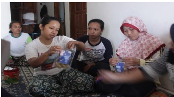
Gambar 4 Pengemasan produk olahan ikan tawes.

Monitoring program dilaksanakan sejak tahap persiapan, pelaksanaan, hingga evaluasi melalui pengarsipan daftar kehadiran peserta, berita acara kegiatan, dan dokumentasi berupa foto dan video. Monitoring program bertujuan untuk mengetahui tingkat partisipasi peserta program dalam setiap tahapan. Adapun evaluasi program dilakukan terhadap keseluruhan program dengan melakukan pre-test dan post-test pada pelaksanaan program. Evaluasi program bertujuan untuk mengetahui keberhasilan program