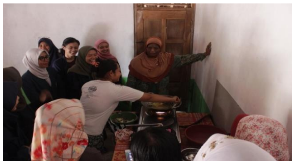
Gambar 2 Pelatihan dan pendampingan pengolahan produk olahan ikan tawes.

Pelatihan diawali dengan penyampaian materi mengenai pentingnya pemasaran, jenis-jenis pemasaran, dan beberapa teknik pemasaran kreatif yang telah dilakukan oleh beberapa produk lokal Indonesia. Jenis pemasaran ada dua macam, yaitu pemasaran secara offline dan online . Bagi peserta, pemasaran yang lebih menarik adalah pemasaran menggunakan media offline , yaitu berupa word of mouth . Para peserta belajar berbagai jenis cara mempromosikan