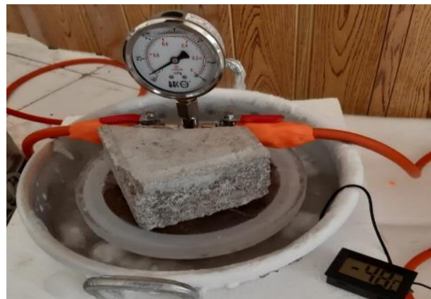
Gambar 3 Proses uji coba alat.

kampus C Universitas Internasional Semen Indonesia. Pertimbangan yang dilakukan untuk mengadakan kegiatan pelatihan di kampus UISI karena lokasi lebih strategis sehingga peserta dapat menjangkau area pelatihan dengan mudah. Disamping itu, peserta pelatihan tidak hanya dihadiri oleh perwakilan unit usaha, namun juga dihadiri oleh perwakilan anggota HPDKI, akademisi, peternak, dan praktisi industri yang berjumlah 27 orang dari kota Tuban, Gresik, Kediri, Malang, Sidoarjo, dan Mojokerto. Materi yang disampaikan di antaranya: