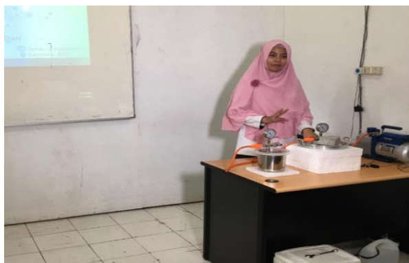
Gambar 5 Proses demo alat freeze drying .