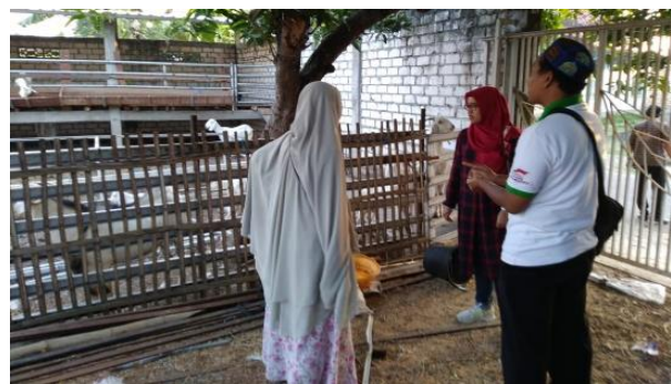
Gambar 2 Proses survei di Puri Farm Living.