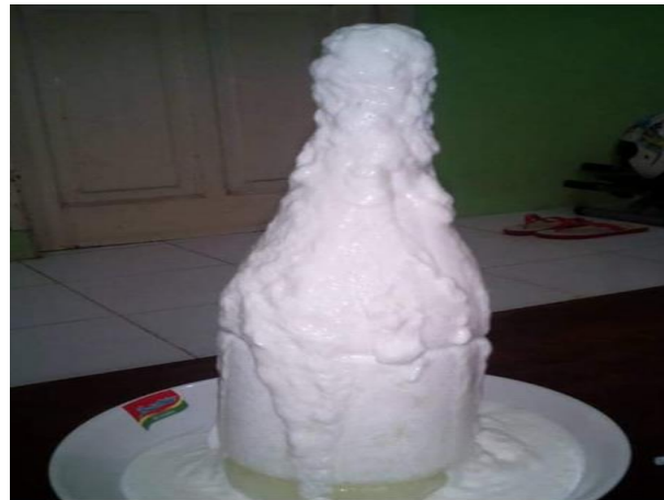
Gambar 1 Kefir yang rusak karena meluap.

Kegiatan pelatihan pemanfaatan metode pengeringan beku ( freeze drying ) untuk mengubah cairan kefir menjadi bubuk diselenggarakan di