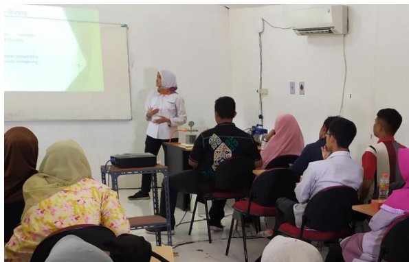
Gambar 4 Proses penyampaian materi konsep freeze drying .

Pemantauan ini bertujuan untuk memastikan mitra menggunakan alat dengan baik dan benar.