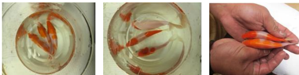
Warna ikan tanpa pemberian spirulina