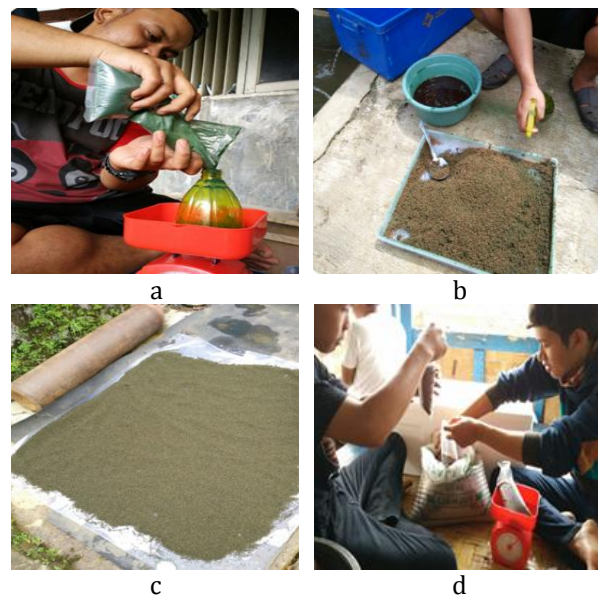
Gambar 3 Tahapan pembuatan pakan oleh peserta penyuluhan di PBC Fish Farm ; a) Penimbangan spirulina; b) Spray pelet dengan spirulina; c) Penjemuran; dan d) Penimbangan dan pengepakan pakan sesuai kebutuhan ikan.

Hasil kegiatan pendampingan menunjukkan adanya perbedaan hasil pendederan ikan koi, seperti yang ditampilkan pada Gambar 4. Berdasarkan kualitas hasil pendederan ikan koi yang diberi pakan spirulina, terlihat kualitas warnanya meningkat dan semakin cemerlang. Pengamatan secara visual oleh para pembudidaya menunjukkan bahwa kualitas warna koi yang diberi pakan spirulina termasuk Grade A hal ini