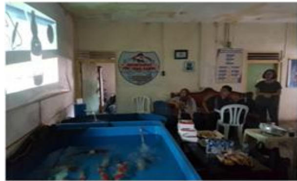
Gambar 2 Pelaksanaan pelatihan.

sesi demonstrasi dan praktik pembuatan pakan, peserta penyuluhan berpartisipasi aktif dan mengikuti semua proses dengan rasa ingin tahu yang tinggi.