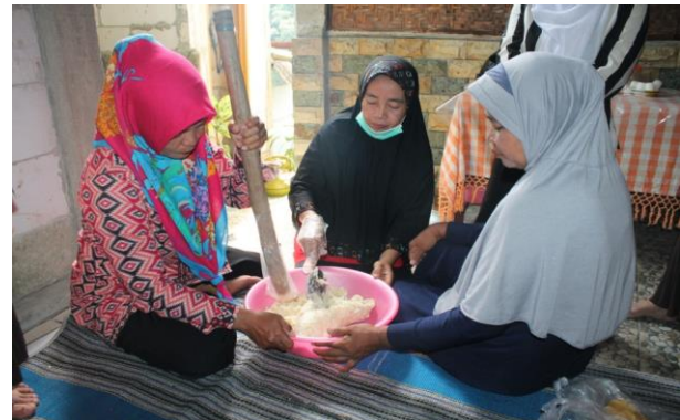
Gambar 3 Praktik pembuatan emping singkong.

Perjalanan awal produksi kelompok UMKM Mekar Usaha tidak sebgasus dan serenyah