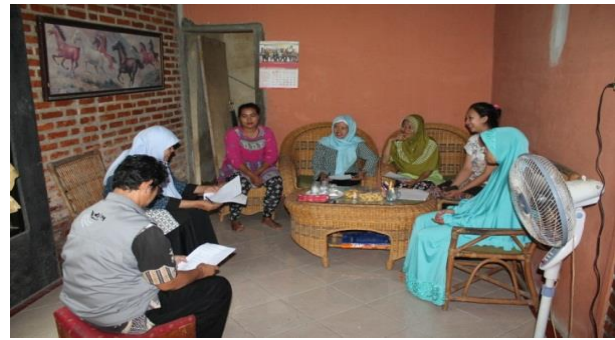
Gambar 2 Sosialisasi program di Desa Neglasari dan Kelurahan Menteng.

cassava chips berupa keripik singkong; dan 3) produktivitas singkong/ubi kayu di Kecamatan Dramaga mencapai 194,28 kw/ha/bulan di mana Desa Neglasari berada.