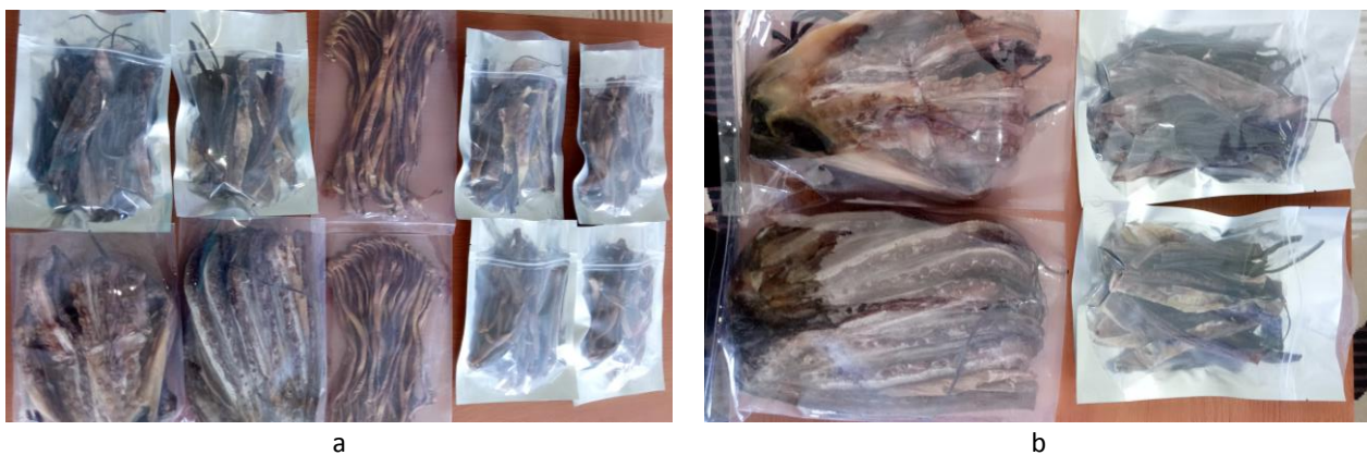
Gambar 3 Produk gurita kering (a) dan produk cacing laut kering (b).