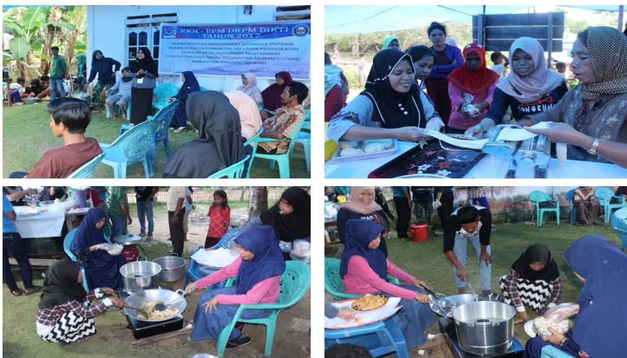
Gambar 5 Pelatihan dan pendampingan pembuatan produk olahan rumput laut dan ikan.

Pada kegiatan praktik pembuatan olahan produk, masyarakat diperkenalkan cara membuat mie dengan bahan dasar rumput laut, bakso berbahan dasar ikan dan rumput laut, dan pembuatan stik/kerupuk berbahan dasar rumput laut. Rumput laut yang digunakan dalam pengolahan ini adalah rumput laut jenis Euchema cottonii atau dikenal dengan Kappaphycus alvarezii . Rumput laut E. cottonii mengandung protein, lipid, karbohidrat, \alpha tokoferol, mineral, vitamin C, dan E (Wandansari et al. 2013; Pringgenies et al. 2013), dapat mensintesis