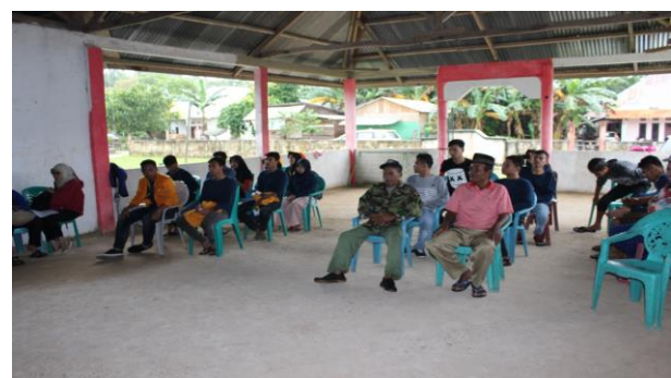
Gambar 4 Sosialisasi pemberdayaan masyarakat di Desa Tanjung Tiram.