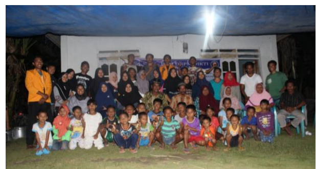
Gambar 8 Serah terima sarana prasarana.