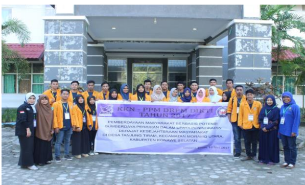
Gambar 2 Kegiatan pemberangkatan mahasiswa ke lokasi KKN-PPM.

Proses pemberdayaan masyarakat dilakukan melalui beberapa tahap, yaitu: 1) Kajian keadaan perdesaan partisipatif, ditujukan untuk mendapat gambaran mengenai aspek sosial, ekonomi, dan kelembagaan masyarakat serta sumber daya alam dan sumber daya manusia; 2) Pengembangan kelompok, dilakukan dengan memfokuskan kegiatan pada masyarakat yang benar-benar tertarik dan berminat untuk melakukan kegiatan bersama; dan 3) Penyusunan rencana dan pelaksanaan kegiatan, dimaksudkan agar kelompok dan anggotanya mampu mengembangkan dan melaksanakan rencana kegiatan yang konkrit dan realistis. Kegiatan yang dimaksudkan adalah kegiatan pelatihan, pendampingan, dan bimbingan teknis (praktik) pembuatan produk olahan seperti mie, bakso ikan rumput laut, dan stik (kerupuk) rumput laut pada kelompok sasaran. Selain itu, juga diadakan kegiatan penyuluhan,