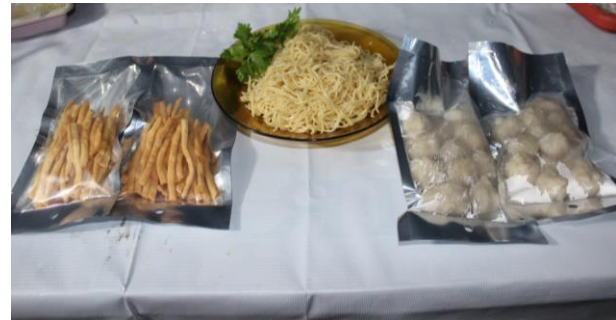
Gambar 6 Produk olahan rumput laut dan ikan hasil kegiatan KKN-PPM.

dan ikan tidak jauh berbeda dari yang dilaporkan Amalia et al. (2016), yaitu sekitar 68,60–79,97%; bakso dan kerupuk yang hanya berasal dari bahan ikan, yaitu berturut-turut 69,59% dan 13,16% (Yanti & Permata 2016). Berbeda dengan kandungan air pada produk mie basah yang berasal dari tepung bonggol pisang, yaitu sekitar 15,50–17,50% (Saragih et al. 2008); dari bahan ubi garut sekitar 52% (Kurniawan et al. 2015). Variasi kandungan air yang dilaporkan tersebut diduga dipengaruhi oleh sumber bahan baku dalam pembuatan produk mie basah. Arnyke et al. (2014) menyatakan bahwa rumput laut mempunyai kandungan air cukup tinggi, yaitu 27,8% (bk). Semakin meningkatnya penambahan rumput laut pada bakso dapat meningkatkan nilai kadar air. Rahmawati et al. (2014) juga menjelaskan dalam penelitiannya bahwa penambahan rumput laut dapat meningkatkan nilai kadar air. Sifat hidrokoloid rumput laut yang memiliki kemampuan menyerap air yang tinggi, mengakibatkan sumbangan air dari rumput laut semakin besar.