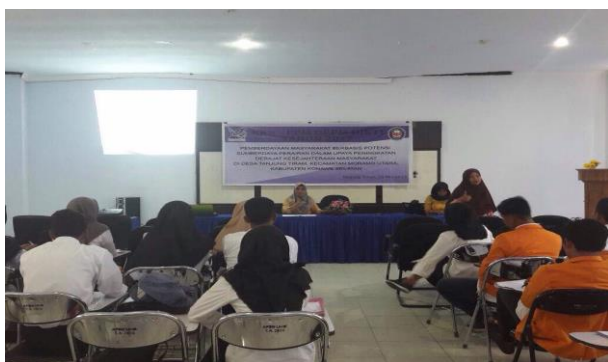
Gambar 1 Kegiatan pembekalan mahasiswa KKN-PPM.

Setelah kegiatan persiapan dan pembekalan, dilakukan pemberangkatan mahasiswa ke lokasi KKN-PPM (Desa Tanjung Tiram) pada Sabtu 20 Mei 2017 (Gambar 2). Mahasiswa berjumlah 25 orang, terdiri dari 12 orang laki-laki dan 13 orang perempuan yang ditempatkan di dua posko berbeda. Mahasiswa peserta KKN-PPM dalam pelaksanaan kegiatan seperti diskusi, pertemuan dengan masyarakat, dan pelaksanaan kegiatan lainnya, menggunakan ruang balai desa, masjid, rumah warga, maupun rumah singgah yang terletak di tepi pantai Desa Tanjung Tiram.