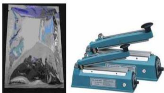
Gambar 7 Peralatan dalam pengemasan produk olahan.

Produk olahan rumput laut memiliki daya simpan yang dipengaruhi oleh kadar air produk. Berdasarkan hasil uji laboratorium (Tabel 2), tiga jenis produk yang dihasilkan memiliki kandungan air yang bervariasi. Kandungan air terendah ditemukan pada produk stik/kerupuk (2,8165%) dan tertinggi pada produk bakso (64,8103%). Kandungan air tersebut dapat meningkat selama proses penyimpanan. Kadar air suatu bahan akan meningkat bila disimpan pada ruangan dengan kelembaban yang tinggi. Kadar air yang tinggi akan membantu pertumbuhan mikroorganisme dan mengakibatkan terjadinya penurunan mutu produk. Selain kadar air, kerusakan produk pangan juga disebabkan oleh ketengikan akibat terjadinya oksidasi atau hidrolisis komponen bahan pangan (Buckle et al. 1987; Fellows & Axtell 1993; Nathanson 1997; Arpah 2001). Produk olahan yang dihasilkan dalam kegiatan KKN-PPM ini berasal dari bahan baku rumput laut yang memiliki kandungan karagenan. Menurut Kampf & Nussinovitch (2000), karagenan merupakan polimer larut air yang berpotensi sebagai pelapis makanan dan digunakan untuk mencegah dehidrasi, makanan kering, dan makanan yang berlemak. Karagenan dapat meningkatkan ketahanan melawan pertumbuhan mikroorganisme