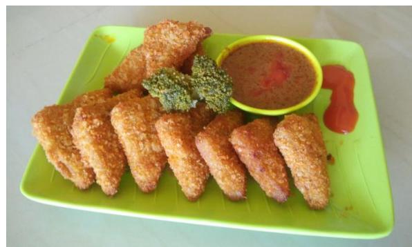
Gambar 4 Contoh produk nugget yang dijual di gerai nugget .