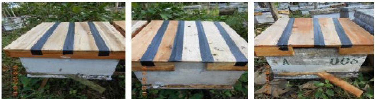
A (ventilasi 0 cm 2 )

Produksi madu dihasilkan pada tiap koloni selama 5 minggu. Pengukuran produksi madu diperoleh dari selisih antara bobot sisiran berisi madu dengan bobot sisiran kosong setelah diekstraksi. Perhitungan bobot madu menggunakan rumus: