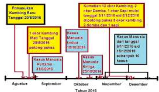
Gambar 1. Time Line Kasus Anthrax di Ngaglik, Purwosari, Girimulyo, Kulon Progo

Informasi bermula dengan adanya kasus anthrax kulit pada manusia yang terkonfirmasi positif akibat Bacillus Anthracis berdasarkan hasil kultur bakteri dari Rumah Sakit Sardjito. Informasi disampaikan oleh Dinas Kesehatan Kabupaten Kulon Progo pada hari Senin 9 Januari 2017. Tanggal 10 Januari 2017 tim surveilans melakukan investigasi di lapangan. Hasil surveilans diketahui adanya kasus kematian mendadak pada sapi dan kambing di Dusun Ngaglik, Purwosari, Girimulyo yang terjadi sejak tanggal 25 Agustus 2016 sampai 2 Desember 2016 dan diikuti anthrax kulit pada manusia seperti pada time line kasus dibawah ini.