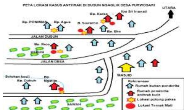
Gambar 2. Peta Lokasi Kasus Anthrax di Ngaglik, Purwosari, Girimulyo, Kulon Progo

kemudian mati dipotong paksa. Jumlah kambing dan domba yang dipotong paksa dan dikonsumsi bersama-sama sebanyak 9 ekor sedangkan sapi 1 ekor. Sampel lingkungan berupa tanah pada tempat pemotongan paksa dan sampel daging sisa pemotongan yang disimpan di kulkas kemudian dikirim ke BBVet Wates dengan hasil kultur bakteri dinyatakan positif Bacillus Anthracis .