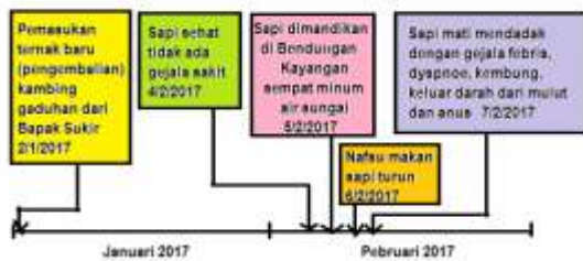
Gambar 3 Time Line Kasus Anthrax di Kepek, Pendoworejo, Girimulyo, Kulon Progo

Akoso (2009) mekanisme penularan penyakit anthrax dapat terjadi melalui aliran air sungai. Awal kejadian kasus anthrax terjadi di Dusun Ngaglik, Desa Purwosari yang merupakan daerah perbukitan kemudian spora terbawa aliran air hujan melalui selokan dan sungai menuju tempat yang lebih rendah ke dusun Kepek Desa Pendoworejo yang merupakan dataran rendah, hal ini seperti dikemukakan Putra (2004) kasus anthrax di perbukitan dapat menular ke daerah yang lebih rendah karena sporanya terbawa aliran air hujan ke daerah yang lebih rendah.