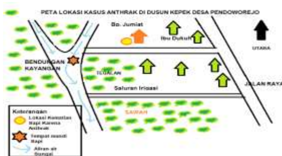
Gambar 4. Peta Lokasi Kasus Anthrax di Kepek, Pendoworejo, Girimulyo, Kulon Progo

Meskipun wilayah D.I. Yogyakarta termasuk dalam provinsi tertular anthrax, tetapi dalam 10 tahun terakhir tidak ada laporan kasus anthrax. Kecamatan Girimulyo Kulon Progo merupakan wilayah tertular baru sehingga kejadian kematian sapi dan kambing merupakan outbreak anthrax. Upaya mengendalikan wabah penyakit anthrax dilakukan dengan beberapa cara yaitu: