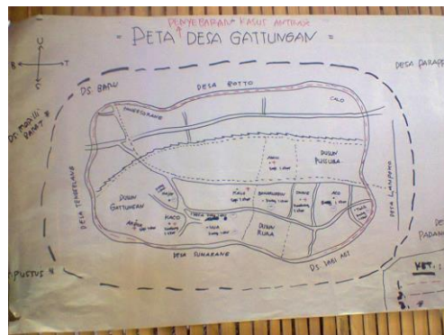
Gambar 3. Pemetaan partisipatif area kasus Desa Gattungan

Perhitungan angka mortalitas terhadap penyakit antraks di Desa Gattungan sebesar 1,45% (sapi) dan 0,41% (kambing), Desa Lagi Agi 14,29% (kambing) sedangkan di Desa Bumiayu sebesar 0,8% (sapi).