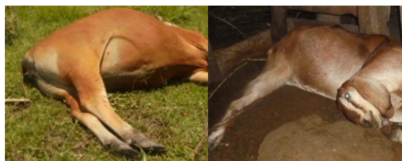
Gambar 4. Gejala klinis berupa kematian mendadak pada sapi dan kambing

Laporan kematian ternak kambing dengan adanya gejala perdarahan pada bagian mulut di Dusun Lelupang, Desa Lagi Agi, Kecamatan Campalagian dilaporkan pada tanggal 7 April 2016. Desa Lagi Agi merupakan wilayah yang berbatasan dengan Desa Rura (lokasi kasus pertama). Pengambilan sampel dilaksanakan oleh petugas dinas dan dilakukan pengujian ulas darah menggunakan pewarnaan Polychrome methylene blue menunjukkan hasil positif morfologi Bacillus anthracis . Sampel darah utuh selanjutnya dikirimkan ke BBVet Maros. Hasil pengujian dengan diagnosis Antraks diinformasikan melalui telepon pada tanggal 8 April 2016. Berdasarkan hasil investigasi, ternak kambing masuk ke lokasi tujuh hari sebelum kematian dan asal ternak dari kelurahan Sidodadi, Kecamatan Wonomulyo. Dusun Lelupang merupakan target ring vaksinasi dari kasus antraks di Dusun Rura (Desa Gattungan), namun saat terjadi kasus belum dilakukan vaksinasi.