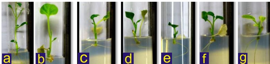
Gambar 1. Klon yang diuji pada percobaan in vitro umur 5 MST*. a) Solanum torvum Sw., b) Solanum melongena cv. Dourga, c) SMST1, d) SMST2, e) SMST3, f) SMST4, g) SMST5.

hijau muda di bagian tengah dan berwarna putih di sepanjang tepi daunnya (variegata), sedangkan klon lainnya dan kultivar pembanding memiliki daun berwarna hijau di seluruh permukaannya (Gambar 1).