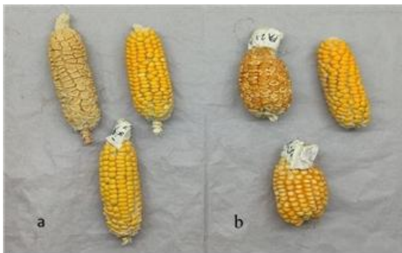
Gambar 2. Fenotipe biji hasil persilangan jagung pulut dan jagung manis. a) persilangan jagung pulut manis dengan jagung pulut; b) persilangan jagung manis biasa dengan jagung pulut