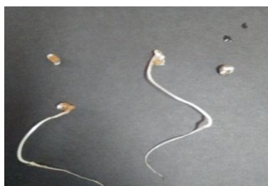
Gambar 3. Struktur kecambah abnormal tomat Tora-IPB pada umur 3 HST

Umur benih pada 3 HST (Hari Setelah Tanam) sebenarnya menghasilkan kecambah, namun kecambah yang dihasilkan bukan merupakan kecambah normal atau kecambah yang sempurna. Kecambah yang dihasilkan tidak menghasilkan bagian-bagian kecambah yang sempurna. Kecambah abnormal pada umur 3 HST seperti yang terlihat pada (Gambar 3).