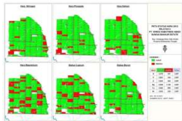
Gambar 1. Status unsur hara kebun SBHE

Penentuan tepat jenis diperoleh dari hasil analisis defisiensi unsur hara secara visual yang penulis amati di lapangan dan disesuaikan dengan data sekunder dari kebun mengenai informasi status unsur hara di kebun pada tahun 2012 untuk menentukan unsur hara yang dibutuhkan tanaman. Berdasarkan data primer defisiensi pupuk secara visual pada Tabel 9 dan status unsur hara kebun SBHE berdasarkan lembaga Riset BGA yang tercantum pada Gambar 1, kemudian diamati kandungan unsur hara pada jenis-jenis pupuk yang diaplikasikan ke lahan telah sesuai dengan kebutuhan unsur hara tanaman atau tidak sesuai.