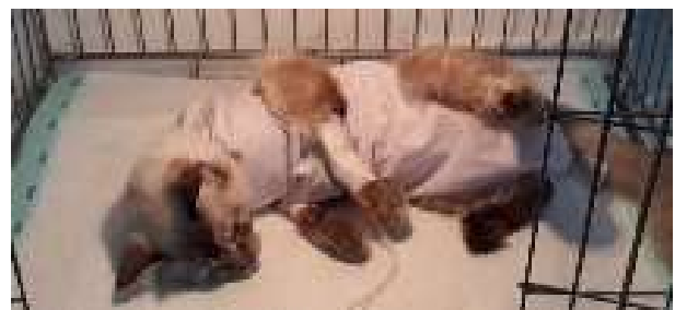
Gambar 1. Kucing Berlin, pasien Klinik Hewan Cimanggu.

pada bagian belakang kucing disekitar anus, keluar cairan berwarna merah seperti darah. Pemeriksaan fisik: Pada palpasi abdomen, perut membesar dan terasa sakit. Ditemukan adanya discharge yang keluar dari vulva. Kucing memiliki bobot badan 2,9 kg dan suhu tubuh 39,0°C. Pemeriksaan penunjang: Ultrasonografi dan pemeriksaan hematologi rutin. Diagnosa: Pyometra Diferensial Diagnosa: Metritis, retained fetal membranes , mucometra , hydrometra dan haemometra .