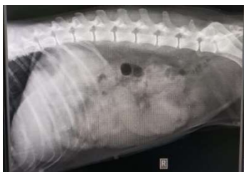
Gambar 1. Radiogram sudut pandang right recumbency anjing dengan diagnosa kasus tumor serviks dan uterus

Hasil pemeriksaan radiografi didapati pada bagian uterus tampak massa radiopaque berukuran \pm 10 cm (Gambar 1). Hal ini merupakan tampilan akumulasi cairan atau massa pada bagian uterus, sehingga perlu penanganan pembedahan dengan ovariohysterectomy (Tophianong & Utami 2019).