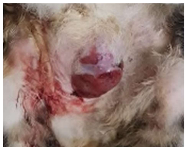
Gambar 1 kondisi kucing Bella dengan pembesaran pada kedua rantai kelenjar mammae yang sudah berlangsung kronis.

Pemeriksaan fisik: Massa yang tumbuh saat dipalpasi sudah mengeras dan tidak mudah untuk digerakkan. Temuan klinis: Salah satu bagian kelenjar mammae yang membesar pecah sehingga terjadi pengeluaran discharge. Pemeriksaan lanjut: X-ray dengan standar pandang ventrodorsal dan lateral recumbency menunjukkan tidak terdapat pertautan massa dengan tulang maupun organ lainnya (Gambar 2). Hematologi lengkap menunjukkan kadar RBC yang rendah (Tabel 1). Diferensial diagnosis: Tumor growth and abscess . Diagnosis: Tumor kelenjar mammae