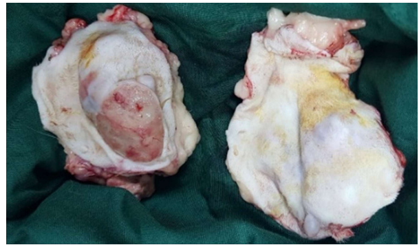
Gambar 2 Tumor mammae dari tubuh kucing Bella yang diangkat dengan tindakan mastektomi radikal.

Perawatan post operasi diberikan injeksi diphenhydramine 0,38 ml IM dan dexamethasone 0,76 ml IM 2x1 selama 3 hari untuk mencegah reaksi alergi dan peradangan pascatransfusi darah. Antibiotik Ceftriaxone 0,8 ml IV, Hematodine 0,75 ml IM, dan Biodin 0,75 ml IM diberikan 1x1 selama 5 hari. Kondisi kucing Bella setelah bangun dari pembiusan bisa dikatakan cukup baik karena sudah mau makan dan minum. Luka jahitan sudah mulai mengering di hari ke-3 pasca operasi, pergantian kassa dan perban dilakukan setiap hari.