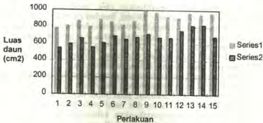
Gambar 3. Pengaruh interaksi (masa tanam II) atas luas daun pada fase pembungaan (series 1)

Bobot polong kedelai berdasarkan analisis sidik ragam memberikan pengaruh yang berbeda pada taraf 1% untuk perlakuan air tersedia. Bobot tersebut adalah 30.92 g untuk A1, 38.24 g untuk A2 dan 45.08 g untuk A3. Baik perlakuan pemupukan maupun interaksinya dengan ketersediaan air, tidak mengakibatkan perbedaan nyata pada bobot polong.