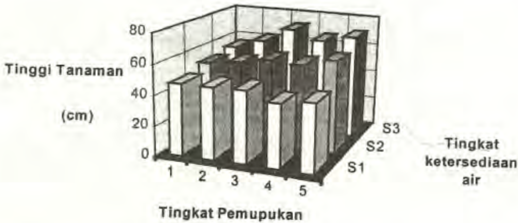
Gambar 2. Pengaruh interaksi ketersediaan air dan pemupukan pada tinggi tanaman

Pada saat fase pengisian polong, perlakuan air tersedia menunjukkan pengaruh berbeda yang nyata. Berat kering akar, batang dan daun bersama sama pada saat pengisian polong tertinggi adalah 21.5 g pada A1, 38.8 g A2 dan 47.6 g A3 untuk perlakuan air tersedia. Perlakuan pemupukan hanya berpengaruh nyata pada berat kering akar, sedangkan interaksi antar kedua perlakuan tidak memperlihatkan perbedaan.