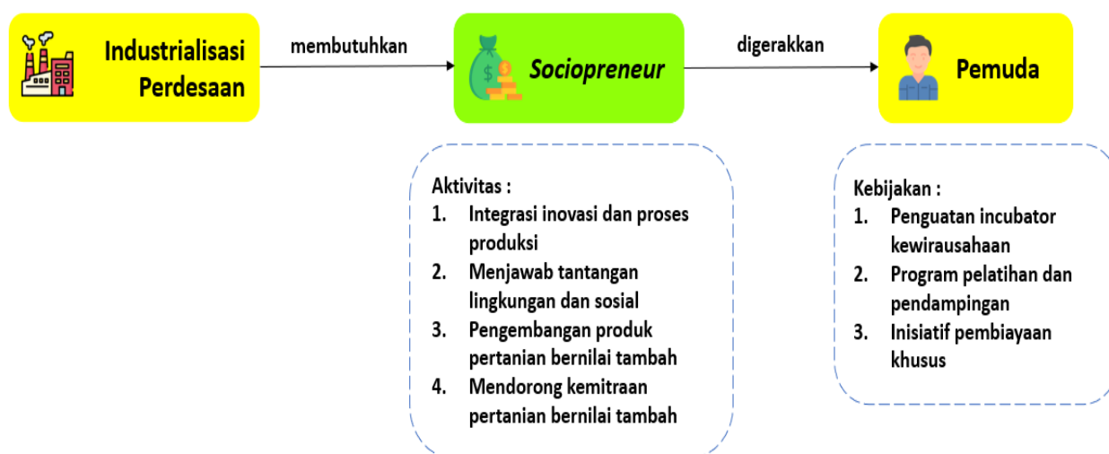
Gambar 2. Framework kebijakan

Identifikasi peluang kewirausahaan adalah hal penting dalam peningkatan pertumbuhan ekonomi perdesaan. Pemuda biasanya terlibat aktif potensi-potensi yang ada di desa dan menjadikan potensi tersebut menjadi peluang bisnis yang berkelanjutan, terutama terkait potensi baru dalam kewirausahaan dan pemasaran (misalnya digital marketing ). Identifikasi kewirausahaan yang dimaksud juga mencakup inovasi solusi terhadap masalah-masalah lokal yang dihadapi masyarakat lokal. Dengan demikian, masyarakat desa bukan hanya merasakan dampak ekonomi, melainkan juga merasakan dampak sosial bahkan dampak lingkungan (Nugroho et al. 2019).