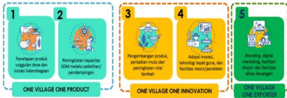
Gambar 3. Pengembangan ekosistem bisnis berbasis perdesaan melalui OVOC

Salah satu best proven practice dari rekomendasi ini adalah One Village One CEO (OVOC). OVOC adalah inovasi sosial dalam melakukan industrialisasi perdesaan yang mengerahkan seperangkat sumberdaya di desa. Ragam program ini dibagi menjadi tiga tahap yakni One Village One Product (OVOP), One Village One Innovation (OVOI), dan One Village One Exporter (OVOE). (Purwawangsa et al. 2023). Program-program inovasi sosial lain tentu perlu terus digalakkan.