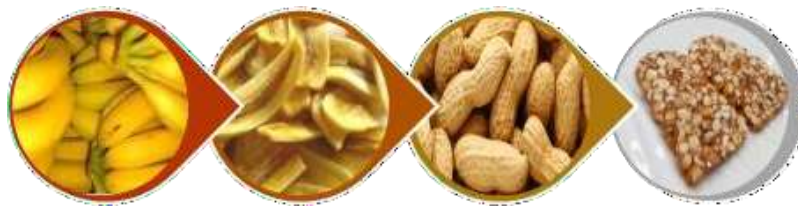
Gambar 1. Tanaman Pertanian pangan dan olahannya

Pemberdayaan UMKM dimulai dengan menguatkan konstruksi keamanan pangan produk yang dihasilkan, misalnya menyelenggarakan asistensi teknis ke pemerintah daerah, meningkatkan jumlah dan kompetensi tenaga inspektur, penyuluh dan pendamping keamanan pangan, serta pemberdayaan sumber daya lokal. Setelah menguatkan konstruksi keamanan pangan UMKM, maka langkah selanjutnya mendemonstrasikan praktek-praktek yang baik dalam menjalankan UMKM (Rahayu et al. 2012). Oleh karena itu, diperlukan investasi berupa keahlian dan keterampilan sesuai UMKM yang dijalankan, dengan cara meningkatkan kepatuhan pemenuhan persyaratan dan mengkomunikasikan risiko dengan instansi pembina. Setelah kedua aspek tersebut dijalankan, maka diharapkan daya saing produk UMKM dapat meningkat, yang dicirikan dengan produk aman dan bermutu, memenuhi persyaratan pasar global dan mampu membangun daya penerimaan konsumen. Pada akhirnya, pemberdayaan UMKM diharapkan mampu meningkatkan perekonomian lokal dan memperluas lapangan kerja, serta peningkatan produktivitas dan nilai tambah.