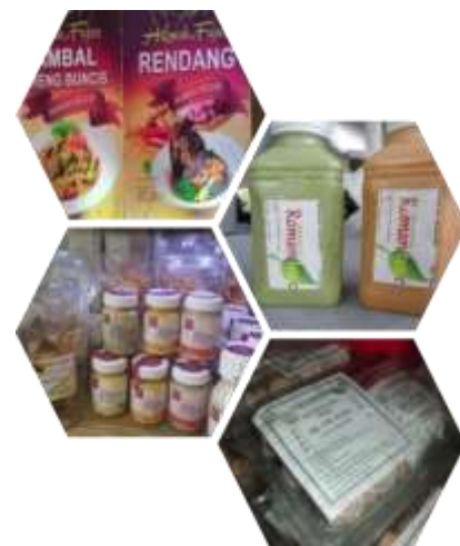
Gambar 1. Contoh produk UMKM di Indonesia

sampai hilir yang meliputi penyediaan bahan baku, proses produksi dan teknologi, keuangan, mutu, pemasaran dan sumber daya manusia (SDM) dan penciptaan nilai tambah, sehingga UMKM mampu bersaing secara nasional maupun internasional (Hubeis et al. 2015). Berdasarkan kondisi tersebut, maka perlu dikembangkan suatu model pengembangan UMKM unggulan berbasis pertanian pangan di Indonesia yang dapat mendorong kesejahteraan rakyat dengan fokus, ditahap awal dipilih beberapa daerah yang memiliki komoditas potensial dengan ketersediaan cukup dan pelaku-pelaku relatif unggul yang terdapat di Bandung, Surabaya dan Palembang.