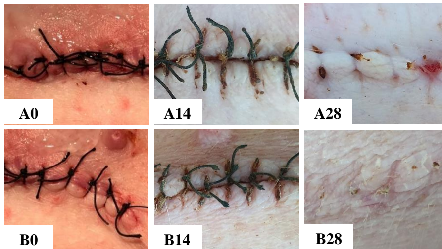
Gambar 2 Gambaran klinis penyembuhan luka jahitan kulit pada babi ( Sus scrofa ) yang diimplan paduan logam Zn-0.5Al dan ZnMg(4x) pada vesika urinaria. Kelompok Zn-0.5Al (A0: luka jahitan pada hari ke-0, A14: luka jahitan pada hari ke-14, dan A28: luka jahitan pada hari ke-28), kelompok ZnMg(4x) (B0: luka jahitan pada hari ke-0, B14: luka jahitan pada hari ke-14, dan B28: luka jahitan pada hari ke-28)

Keterangan: skor 1 waktu penyembuhan kurang dari 7 hari; skor 2 waktu penyembuhan antara 7-14 hari; dan skor 3 waktu penyembuhan lebih dari 14 hari