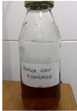
Gambar 1 Herbal cair kombinasi ekstrak daun pepaya dan kelopak bunga rosella