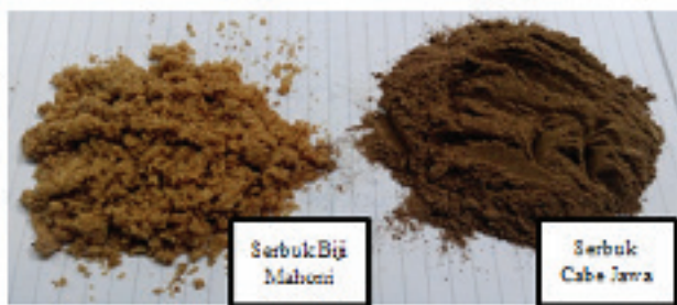
Gambar 1 Serbuk simplisia buah cabe jawa dan biji mahoni

Selain pemeriksaan secara organoleptik, pemeriksaan lain juga dilakukan terhadap simplisia serbuk berupa penentuan kadar air dan kadar abu. Hasil pemeriksaan kadar air serbuk buah cabe jawa dan serbuk biji mahoni yaitu 4,15% dan 4,22%. Kadar air tersebut memenuhi syarat karena tidak lebih dari 5% (Voight, 1994). Sedangkan hasil penentuan kadar abu pada serbuk buah cabe jawa dan serbuk biji mahoni yaitu 3,44% dan 3,73% sehingga memenuhi persyaratan karena tidak lebih dari 6% (Depkes, 2008).