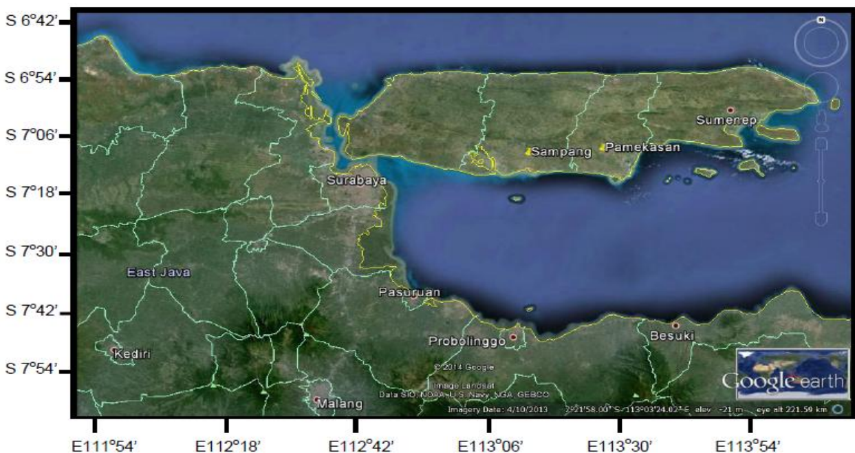
Gambar 1 Lokasi pengambilan sampel di Pulau Madura, yaitu Sampang dan Pamekasan.

Sampel DNA yang digunakan adalah sampel darah sapi Madura yang dikoleksi berdasarkan peruntukan sapinya, yaitu sapi karapan diperoleh dari Kabupaten Sampang, serta sapi sonok dan sayur diperoleh dari Kabupaten Pamekasan (Gambar 1). Sampel darah diawetkan dalam alkohol absolut koleksi Dr. Achmad Farajallah. Umur sampel sapi yang digunakan dalam penelitian ini berbeda, umur sapi karapan dua tahun, sapi sonok tiga tahun, sedangkan umur sapi pedaging tidak diketahui. Ekstraksi DNA dilakukan dengan mengikuti protokol extraction kit yang digunakan, yaitu Genomic DNA Mini Kit for Fresh Blood (Geneaid). Amplifikasi ruas ekson 8 gen BCKDHA dilakukan menggunakan mesin PCR ESCO Swift Maxi Thermal Cycler dengan kondisi: predenaturasi 95 °C selama dua menit, dilanjutkan dengan 30 siklus yang terdiri atas denaturasi 95 °C selama 45 detik, penempelan primer 60 °C selama satu menit, pemanjangan DNA pada suhu 72 °C selama satu menit, dan diakhiri dengan pemanjangan DNA 72 °C selama lima menit. Primer AF511 (5'-GAATGGAAYGGAGGCCAGAG-3') dan AF512 (5'-CCCRGCCTCTCCMTTCTT-3') digunakan untuk mengamplifikasi 410 pb nukleotida ruas intron 7–8. Ruas intron 7 (termasuk primer AF511) terdiri atas 150 pb, ekson 8 172 pb, dan intron 8 (termasuk